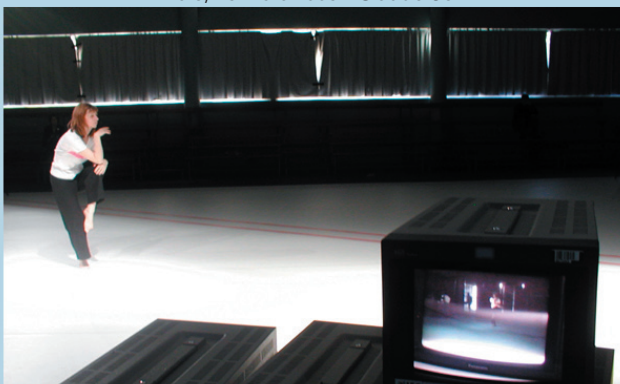
Bal6, 13 mars 2003 - Claude Sorin